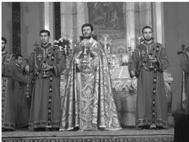
Örmény liturgia: úrfelmutatás

rű tartományi rangra süllyedt. A királyságot megszüntették, a tartomány élére marzpant ültettek. A katolikoszt, Szent Nersészt elhurcolták a birodalom belséjébe és fogságban tartották. Helyette egymás után két ellenkatolikoszt tettek meg egyházfőnek, akiket a Szászánida Birodalom területén működő szír egyházból választottak ki. Ez az egyház a legrégebbi keresztény közösség, amely a Római Birodalom területén kívül létesült, mégpedig Mezopotámiában, Ktésziphón központtal. A II. században már biztosan fennállt, a neve ekkor Kelet Egyháza volt. Később Nesztoriánus, illetve Asszír Egyháznak is nevezték. Rítusa az ún. káld rítus.