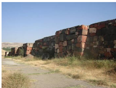
Erebuni erőd külső falának részlete (Kr. e. 782)

Urartuban a IX. század elejétől a VI. század elejéig a Lutiprida -dinasztia uralkodott. Első jelentős királyuk I. Szarduri