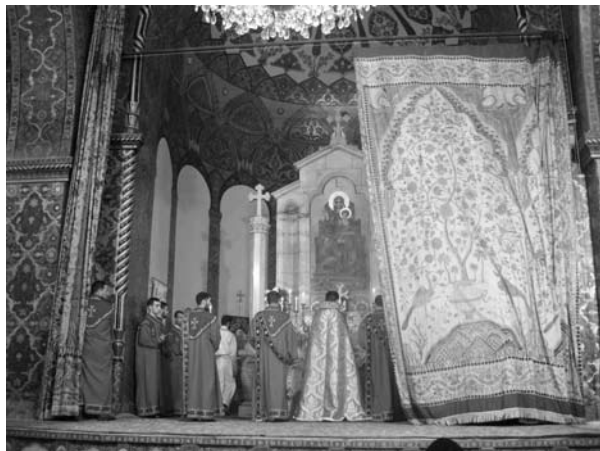
Örmény liturgia: behúzzák a kis függönyt

Az ötödik század első felét az örmény történészek „homályos fejezetnek” tartják. Mivel az örménység politikailag megosztott volt, az országot és az egyházat pedig hirtelen lefejezték, a források homályosak és ellentmondóak. Az örmény nyelven mondott liturgiának a kezdete is erre az időszakra tehető. A mise szövegét, ahogyan a Bibliát is, görögből fordították, ám nem világos, hogy a szír rítusok milyen mértékben befolyásolták.