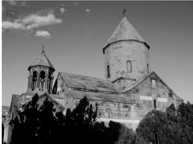
Khor Virap kolostor

Az Örmény Királyságot I. Artasesz (Kr. e. 189-160) hozta létre. Mintegy száz évvel későbbi utóda, II. ( Nagy ) Tigrán (Kr. e. 95-55) volt az, aki egyesítette az akkor még egymástól függetlenül létező örmény államokat. Nagy Tigrán a legjelentősebb örmény uralkodónak mondható. Elfoglalta a szomszédos államokat: Kappadókiát, Szíriát, Palesztina egy részét, Mezopotámia északi