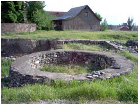
Kör alakú épület alapjai Sengavitből (Kr. e. VI. évezred)

A Kr. e. II. évezredben továbbra is építenek városerődöket. Az épületek ma-