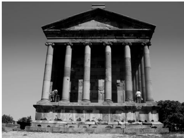
Garni. Pogány templom

Asszíria vereségét követően, a Kr. e. VI. század elején I. ( Rövidéletű ) Ervand alapított államot az egykori Urartu területén. Ő az ún. Nagy-Ör-