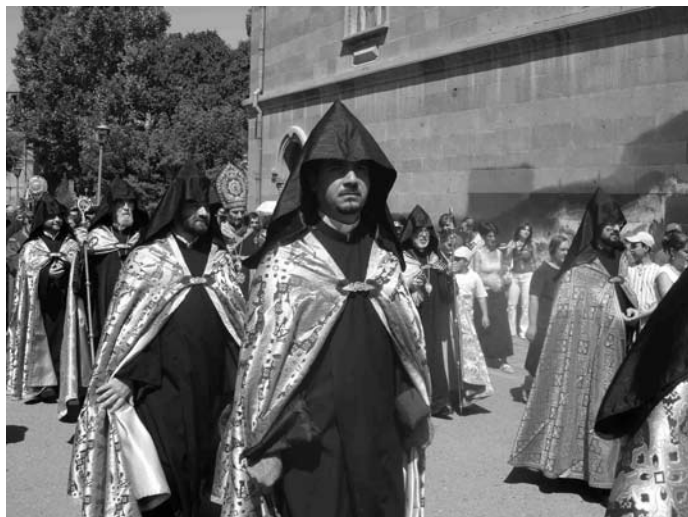
Örmény liturgia: szőlőszentelési körmenet

következmenyeképp az ún. keleti ortodox egyházak elszakadtak. Mivel az örmény püspökök nem voltak jelen, és a zsinaton történekről hamis információkat kaptak, ők is az elszakadt egyházakhoz csatlakoztak. Az 505/506-ban tartott I. dvini zsinaton, majd az 553-as II. dvini zsinaton úgy határoznak, hogy az Örmény Apostoli Egyház elutasítja a Khalkédóni Zsinaton megfogalmazott tanításokat. Emiatt egészen a XX. század második felében lezajlott teológiai párbeszédig az Örmény Apostoli egyházat is, a többi keleti ortodox egyházzal együtt eretnek egyházaknak tartották. 1996-ban II. János Pál pápa