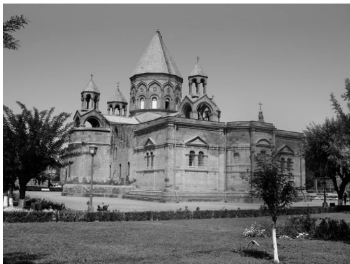
Szt. Ecsmiadzin Székesegyház

A VII. század végén új hatalom jelent meg a Közel-Keleten: a Méd Birodalom. Ők Babilonnal szöveterküdtek Asszíria ellen, és ebbe a szövetségbe