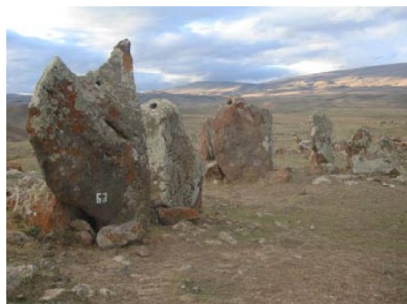
Megalitokból álló csillagvizsgáló Sziszián mellett (Kr. e. V. évezred)